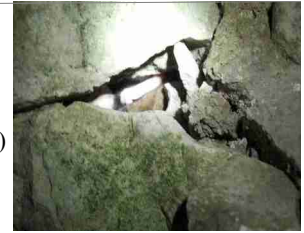
Lérot, Tupigny, 2011