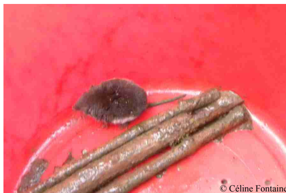
Crossope aquatique dans un seau de crapauduc.

Les seaux des barrages temporaires à amphibiens sont des pièges pour les micro-mammifères. Le Crossope aquatique y est fréquent.