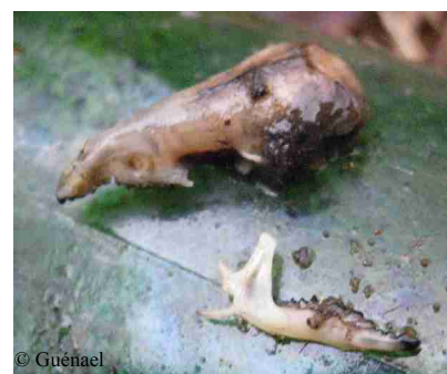
Restes de Musaraigne couronnée dans une canette.

Les canettes jetées au sols forment des pièges mortels pour les micro-mammifères. Il s'agit principalement des canettes et bouteilles légèrement enfoncées dans le sol et avec l'ouverture inclinée vers le haut.