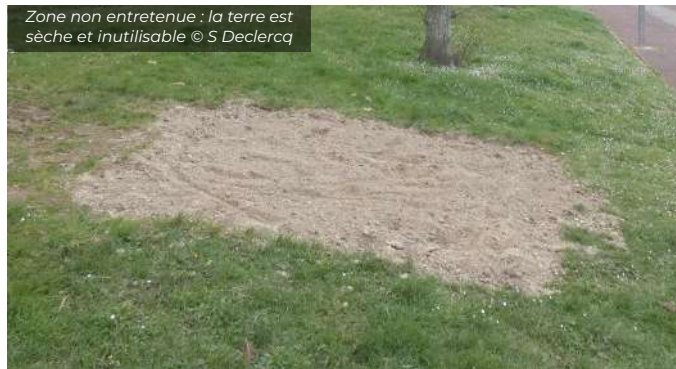
Zone non entretenue : la terre est sèche et inutilisable