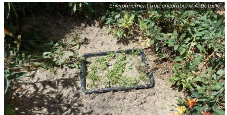
Environnement trop encombré