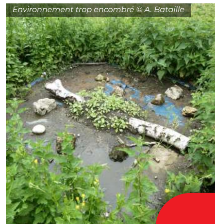
Environnement trop encombré