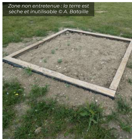
Zone non entretenue : la terre est sèche et inutilisable