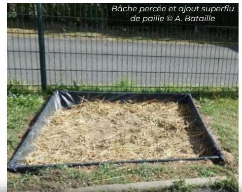
Bâche percée et ajout superflu de paille

Les actions menées par Picardie Nature sont permises par le soutien et la participation des adhérents, des donateurs et des bénévoles ainsi que par la collaboration et l'aide de différents partenaires.